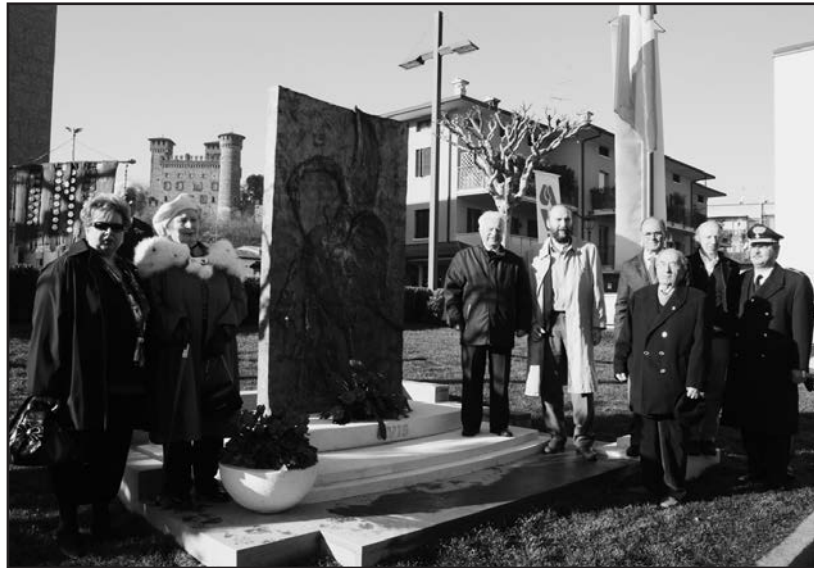
Inaugurazione monumento domenica 16 novembre 2008.