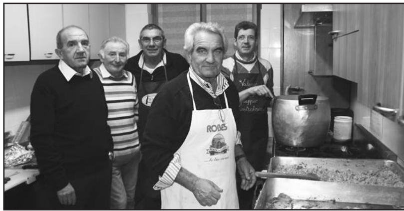
Gli addetti alla cucina.

Infatti, dopo la messa concelebrata da don Lussignoli e dall'a-