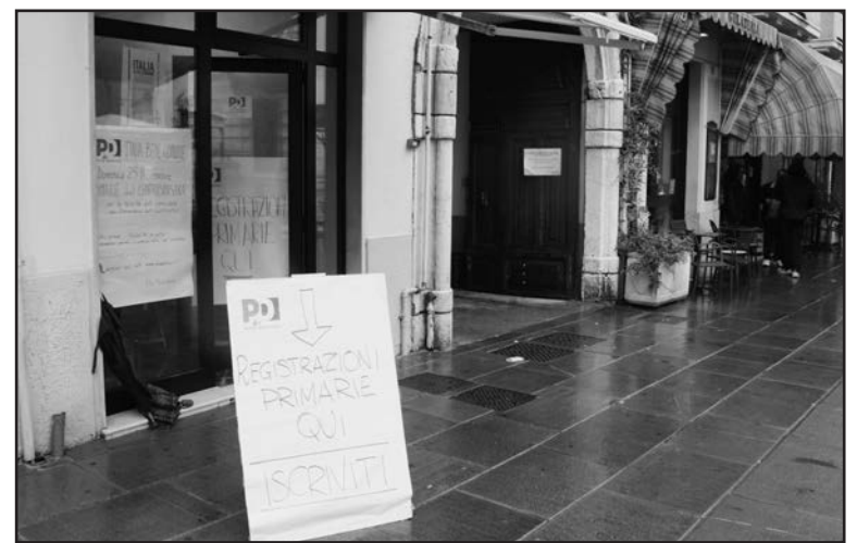
La sede in Piazza S. Maria.