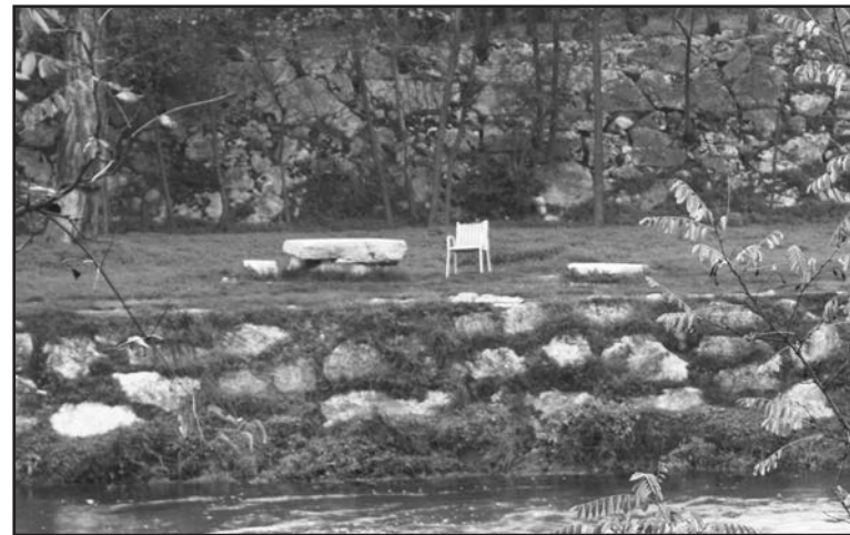
La sedia bianca, sola nel pianoro lungo l'argine del Chiese, ricorda l'allegria brigata di giovani di quest'estate.

consueti sosta, la cateratta sotto il canalone è più violenta e fragorosa, verso la brughiera un tramonto di fuoco fa da sfondo a piccoli stormi di uccelli scuri che navigano lenti verso occidente. Penso al cacciatore di Carducci nella poesia San Martino : “... sta il cacciatore fischiando / su l'uscio a rimirar // tra le rossastre nubi / stormi d'uccelli neri, / com'esuli pensieri, / al vespero migrar.” Questi “esuli pensieri” li sento anche miei, forse sono propri della natura umana, dell'uomo che non può impedire alla sua mente di pensare. E il suo pensiero è per lo più esule, solitario, forse alla ricerca di un pensiero fratello col quale aprirsi e comunicare nel dono raro dell'ascolto. La natura, la poesia e la bellezza, nella verità che misteriosamente espri-