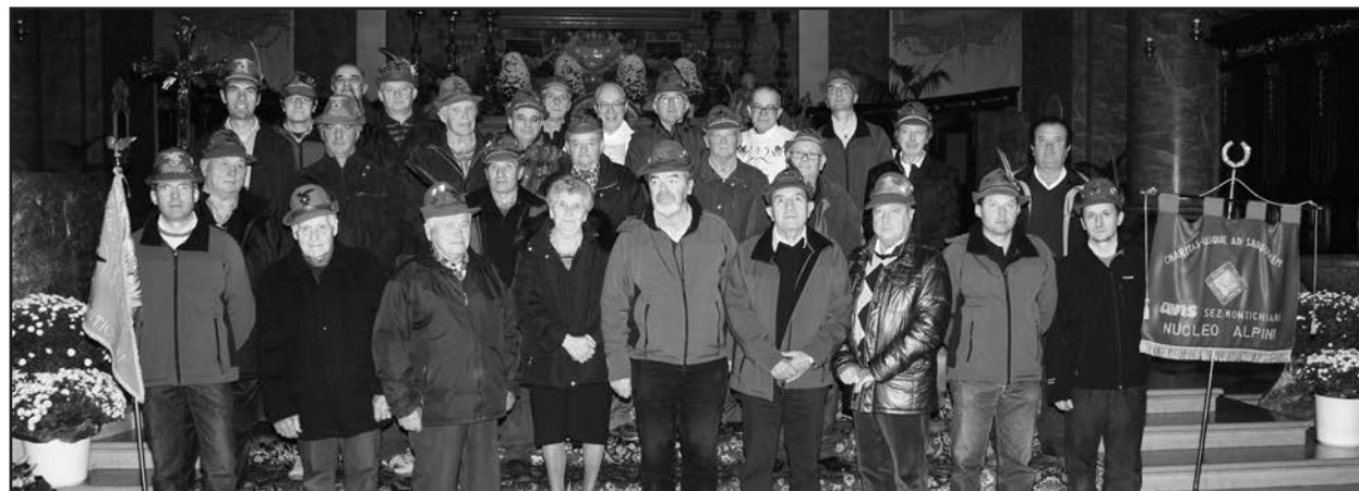
Ricordo dei partecipanti alla messa in Duomo.

data per “ricordare” e “rinsaldare” lo spirito di corpo. Prossimi appuntamenti gli incontri per le feste di Natale.